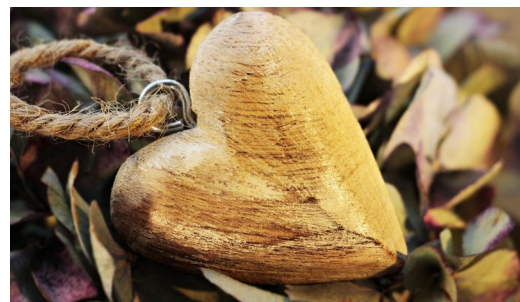
aus: Valentinstag für Paare, Diözese Würzburg

Meine Hand in Deiner Hand ich vertraue Dir an meine Hand meine Gedanken Gefühle was ich mitbringe und wer ich zukünftig mit Dir zusammen sein kann. ... Wir beide mit unseren Grenzen und Möglichkeiten eingeladen zu vertrauen auf SEINE Nähe